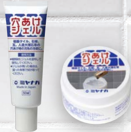
穴あけジェル (別売)